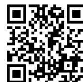
講座WebページQRコード

https://www.dei.or.jp/school/kouza_idouyo