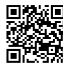
講座WebページQRコード

https://www.dei.or.jp/school/kouza_mkanalyst2023